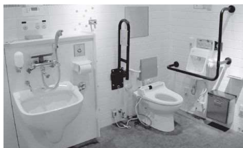
【参考】オストメイト対応設備

※ 県のホームページでは「ユニバーサルシート付多機能トイレのある県・市町村有施設」及び「オストメイト対応トイレのある県有施設」の情報を掲載しています。